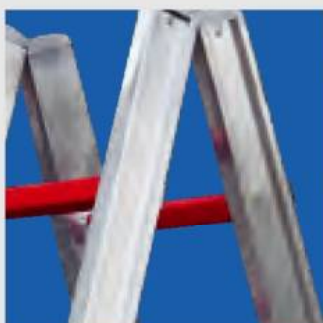
Könnyen tisztítható és magas szilárdságú külső szár

A létrát gyártó cég több mint 100 éves tapasztalattal rendelkezik a tűzoltó létrák gyártásában. Beszállítónk üzemében már több mint 100 éve nagy odafigyeléssel és hozzáértéssel készítenek tűzoltó létrákat. Az innovatív gyártási eljárásban a nagyszilárdságú létrafokokat a szár belső oldalába bemarva és behegesztve rögzítik. A szár külső szélé emellett masszív marad, minek következtében a kis önsúly mellett is egy csavarodásnak jól ellenálló létra készül. Mivel a száruk külső felülete sima, ezért a létráinkat könnyen lehet tisztítani, és így a legmagasabb biztonság mellett a létrák könnyű kezelhetősége is fontos előnyt jelent a felhasználóknak. Az így kialakított tűzoltólétrák minőségére a gyártó 20 év garanciát vállal.