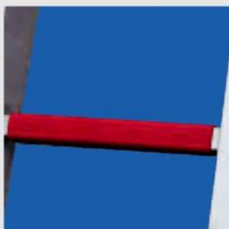
Valamennyi létrafok egy jól megfogható bevonattal van ellátva