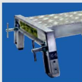
Dugólétra összekötő tag