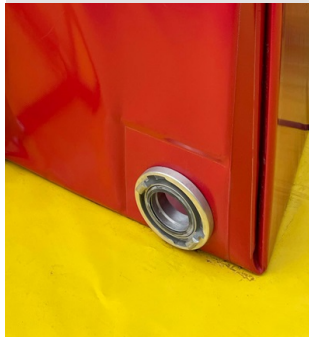
Leeresztő csanak B75 kapoccsal, amely golyóscsappal is felszerelhető