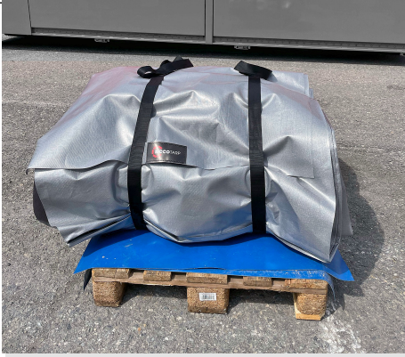
Egyszerűen összehajtható, szállításkor és tároláskor kevés helyet foglal