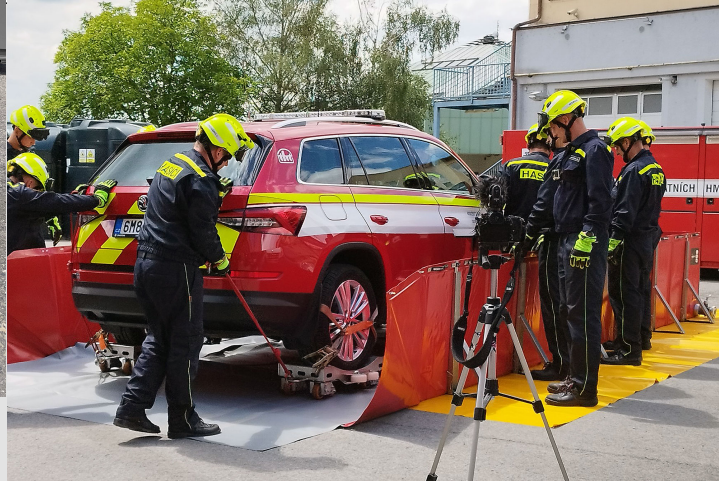
A tartály lehajtott oldalán keresztül könnyen be lehet tolni az autót a konténerterbe.