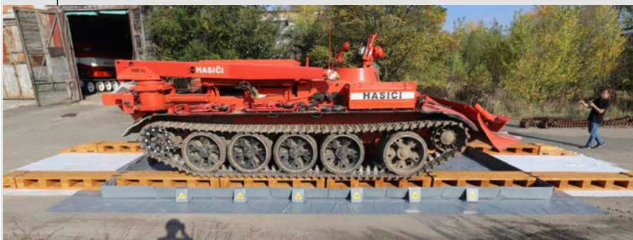
Részlet: Egy láncalpas jármű felhajtása a fa rámpára