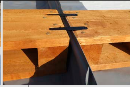
Részlet: a fa rámpa letakarása