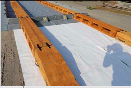
Tálca Fából készült felhajtó rámpával