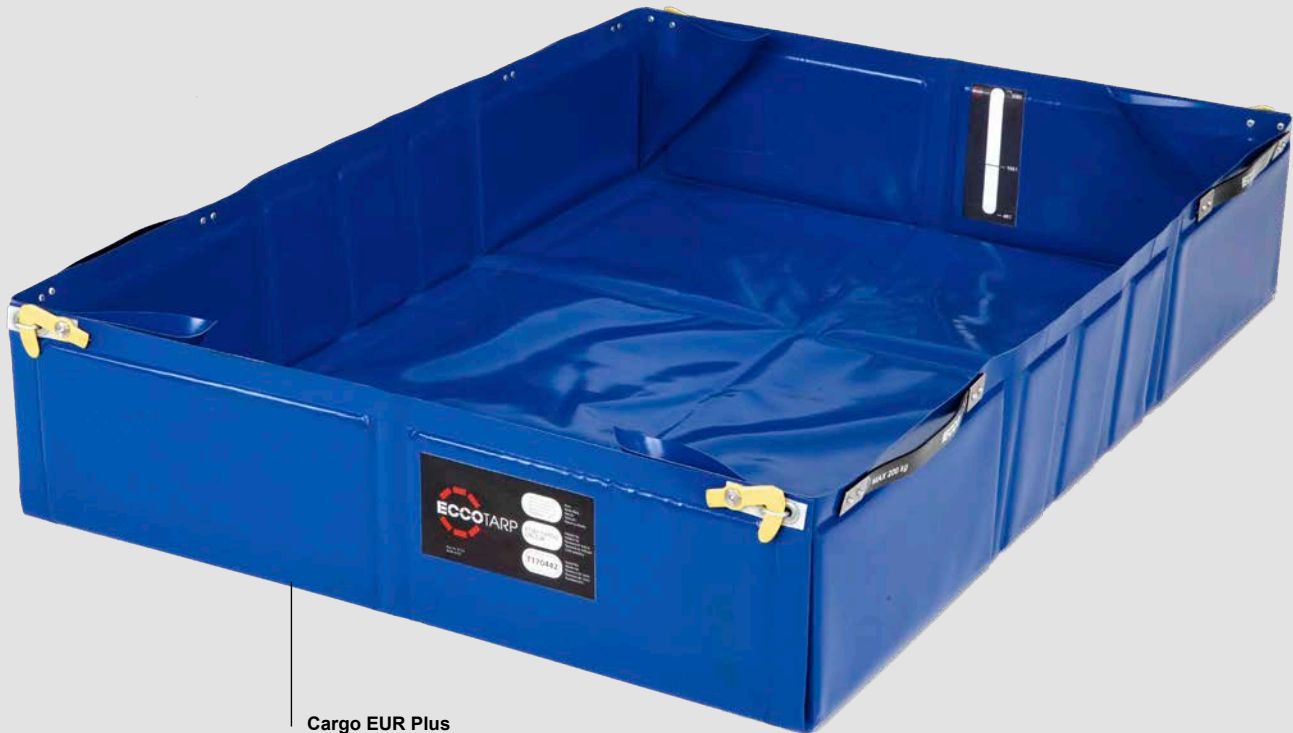
Cargo EUR Plus fogantyúkkal