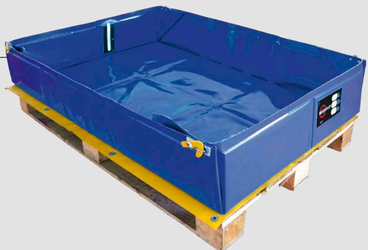
Cargo EUR fogantyúk nélkül

Alakjuk és méretük kifejezetten ipari és szállítási felhasználásokhoz illeszkedik.