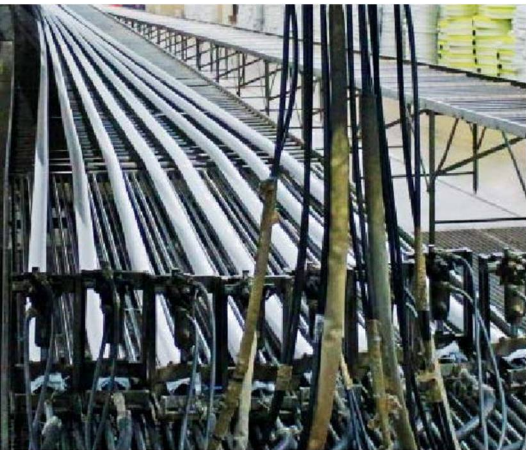
Vulkanizálás folyamata a 60 m hosszú fűtött asztalon