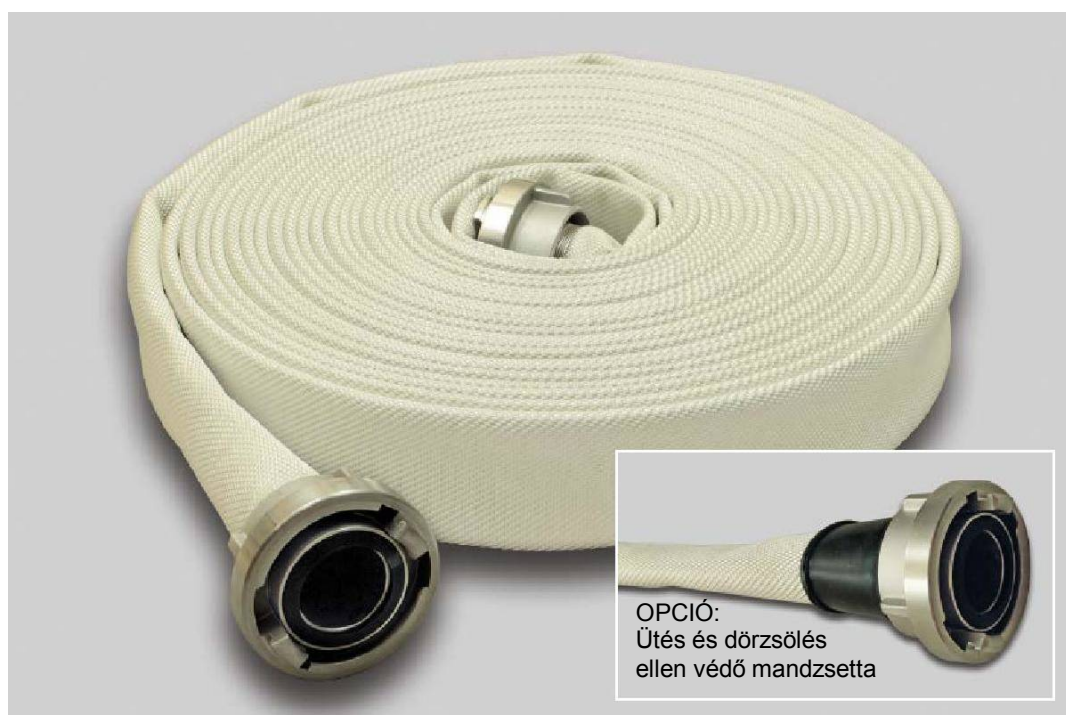
OPCIÓ: Űtés és dörzsölés ellen védő mandzsetta