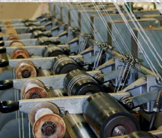
Fonal vezetése a lánc ill. vetülék szálaknál