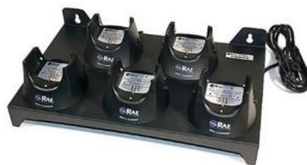
Csoportos akkutöltő 5 db műszer töltésére