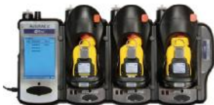
AutoRAE 2 Automatikus Teszt és Kalibráló rendszer