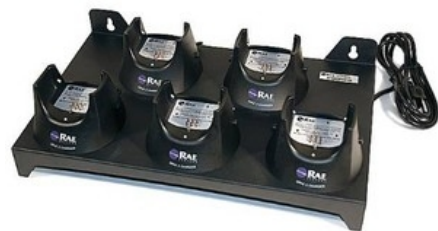
Csoportos akkutöltő 5 db műszer töltésére