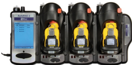
AutoRAE 2 Automatikus Teszt és Kalibráló rendszer